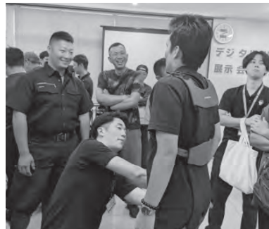
アシストスーツ体験の様子

体験会では点検ドローンやアシストスーツ類などを実際に体験してもらいました。点検ドローンは赤外線センサーを用いてどのように見えるかの実演を行うなど興味深い展示を行うとともに、アシストスーツの体験など、様々な機器を試すことのできる展示会となりました。