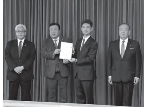
県内商工三団体が知事に要望