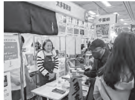
販わう出展ブース